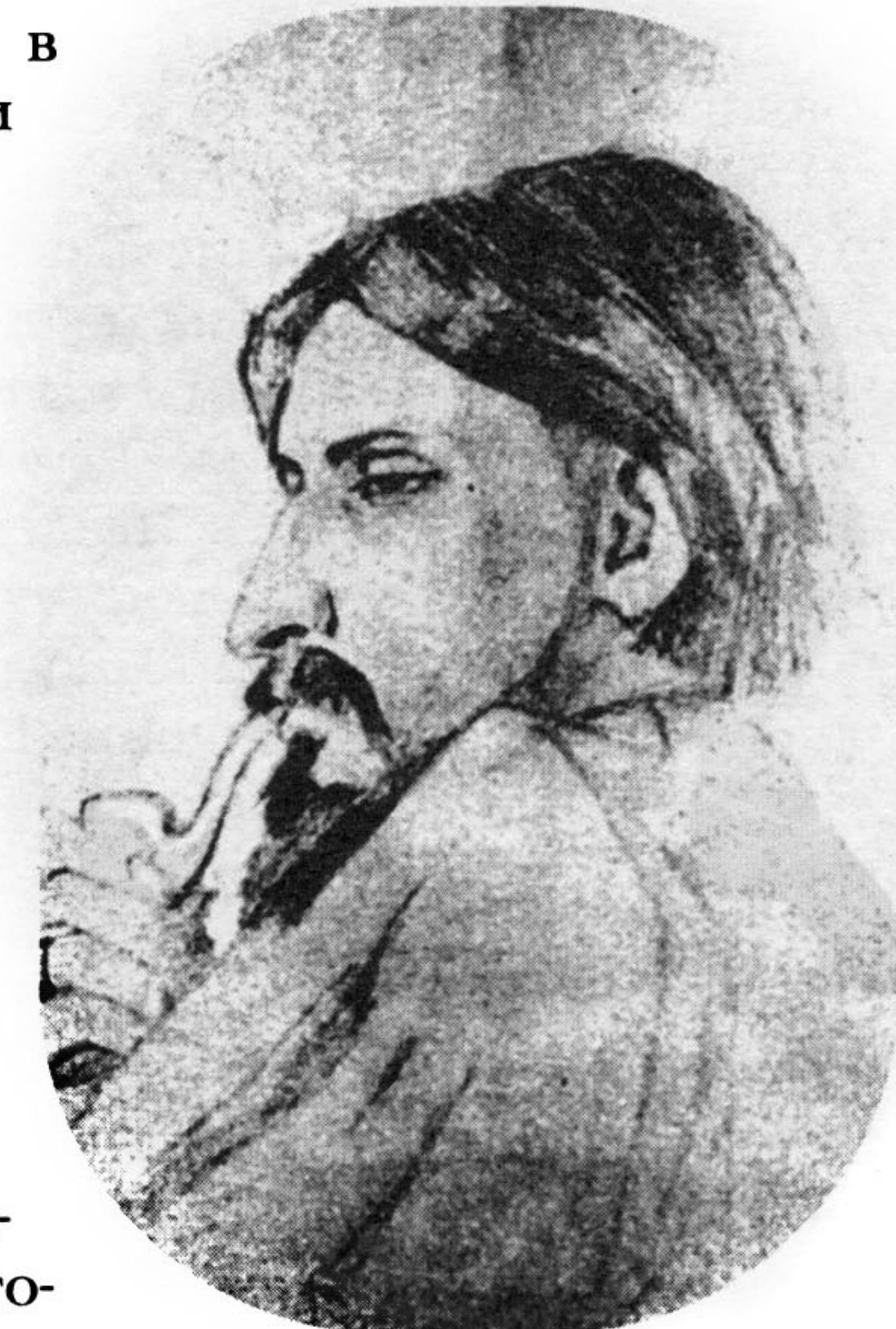
Рис. Л. Н. Верховской