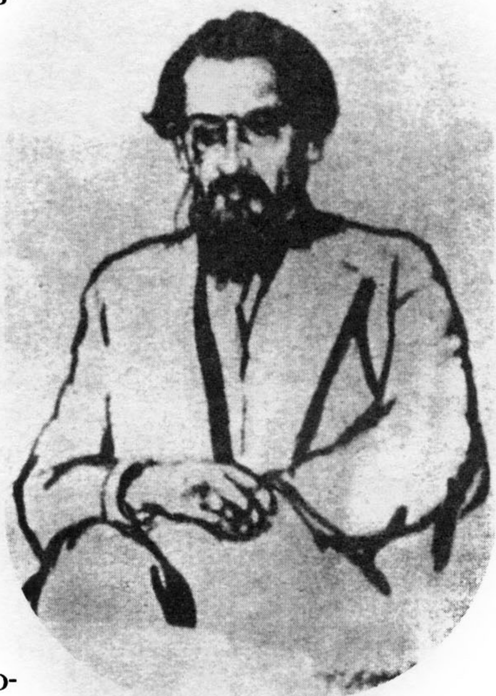
Рис. Г. Верейского

Карсавин ясно видел, что христианство не вправе оставаться неизменным в изменившемся мире. Он определил свое понимание живого действенного христианства как альтернативы тому «отвлеченному», как он его назвал, христианству, черты которого он находил и на Востоке, и на Западе. Узнается здесь что-то от раннего Соловьева,